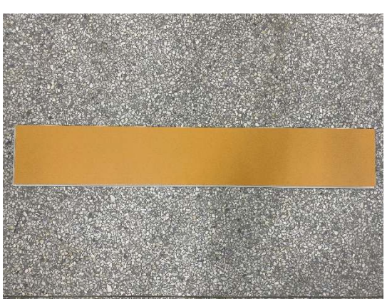
Received Sample (back view)