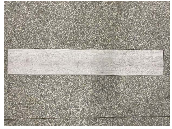
Received Sample (front view)